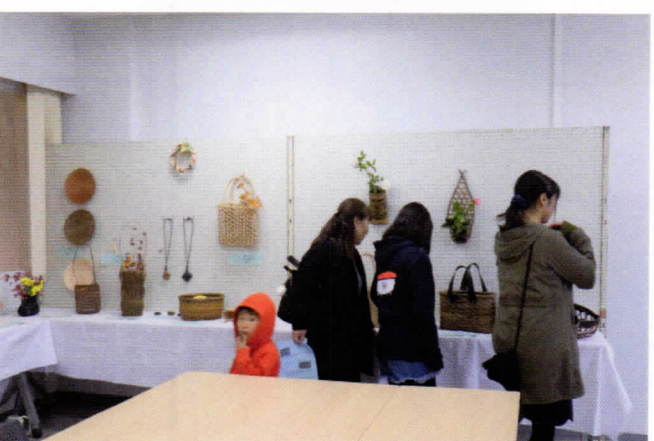
心に懐かしさをいざなう藤工芸