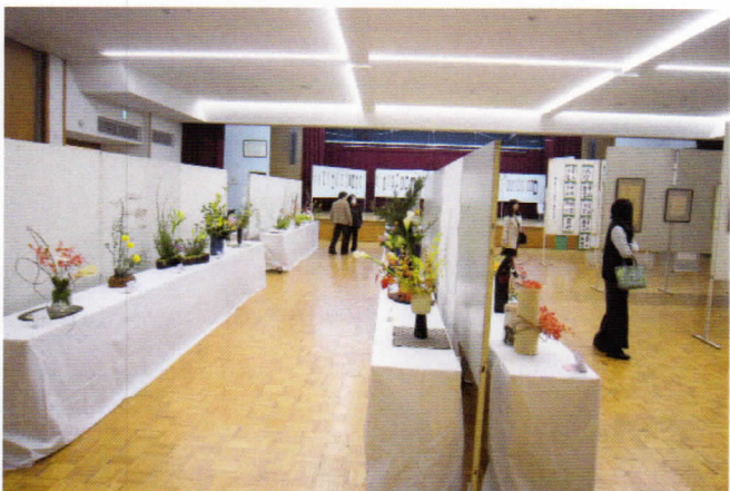
花の個性を生かす日本伝統の生け花(華道)