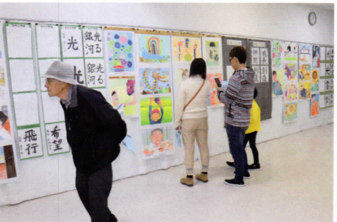
作品から子供たちの成長が伺えます