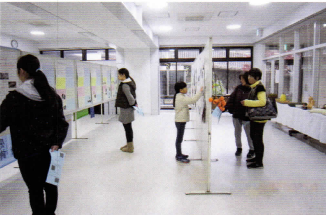
心の栄養・オーストラリアのホームステイ報告記