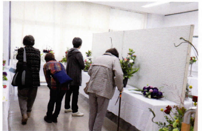
たくさんの花と彩りのフラワーアレンジメント