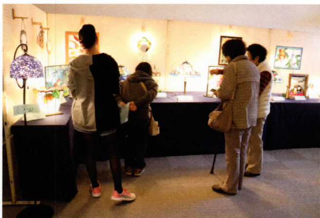
心なごむ硝子の変身スタンドグラス