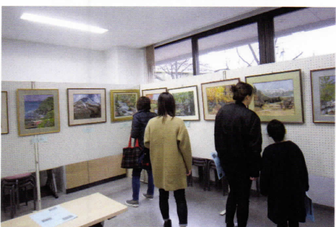
小さな紙片と根気勝負のちぎり絵