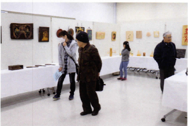
木片に魂をふきこむ彫刻作品