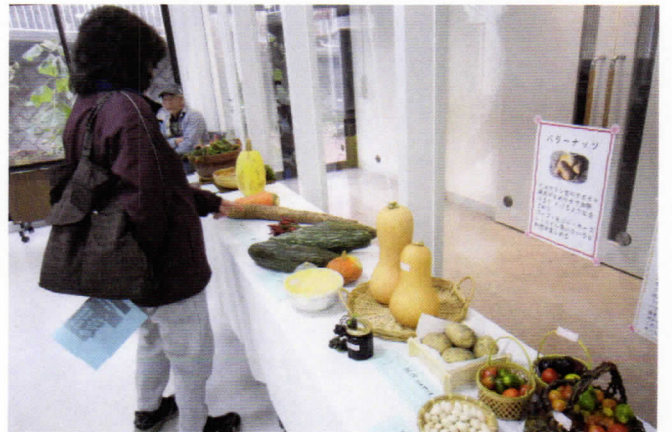
ひょうたんではありません。カボチャです