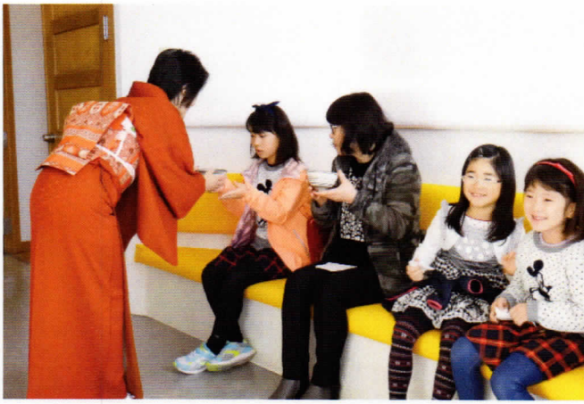
お茶をいただくって緊張するね！

11月18日、19日に第14回 東御市総合文化フェスティバル が中央公民館全館で開催さ れました。 約1,000点以上の作品等が集 まり、文化の薫る秋に彩りを 添えました。