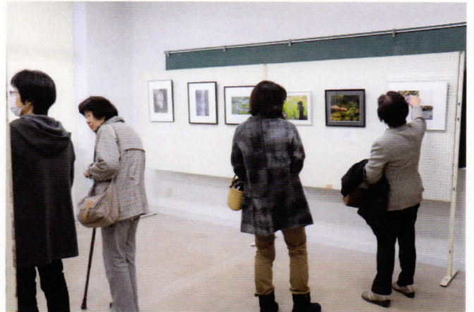
心の中に思いをめぐらす1枚の写真