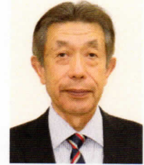
東御市文化協会長