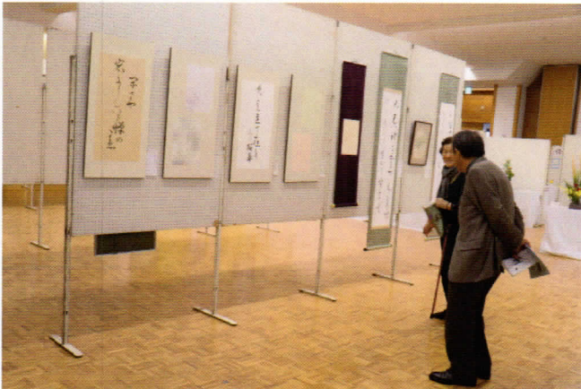
こころに染み入る書の魅力