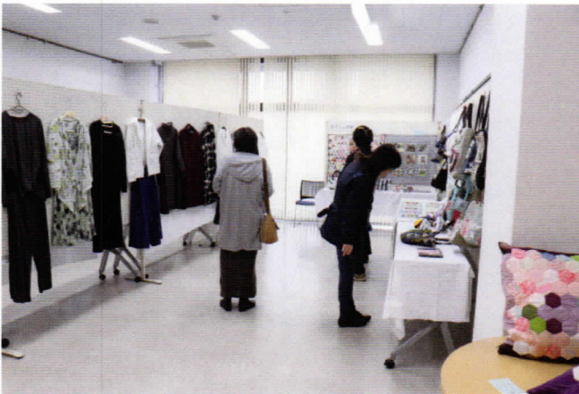
女性の心を誘う手芸コーナー