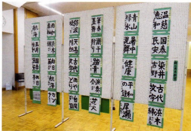
作者の心理が見える書道の作品